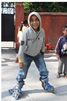
Ishor elsker de nye rulleskøjter.