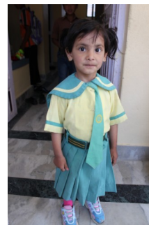
Shristi i skoleuniform...