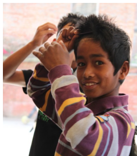
Når man skal i skole må frisen være i orden...